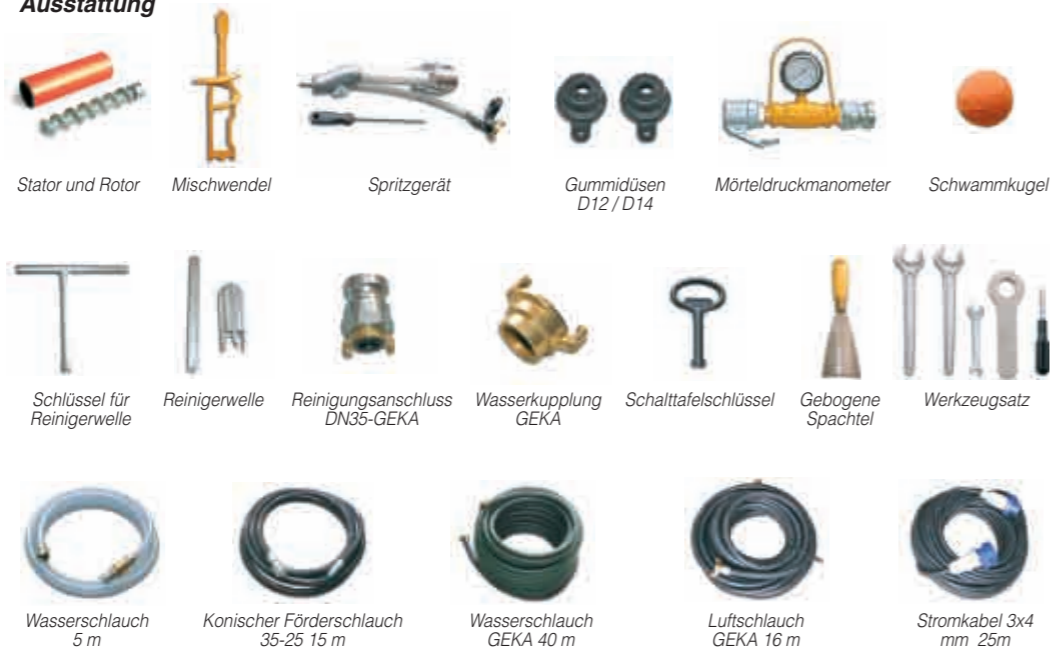
Stator und Rotor Mischwendel Spritzgerät Gummidüsen D12 / D14 Mörteldruckmanometer Schwammkugel