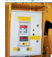
avec memory card intégré