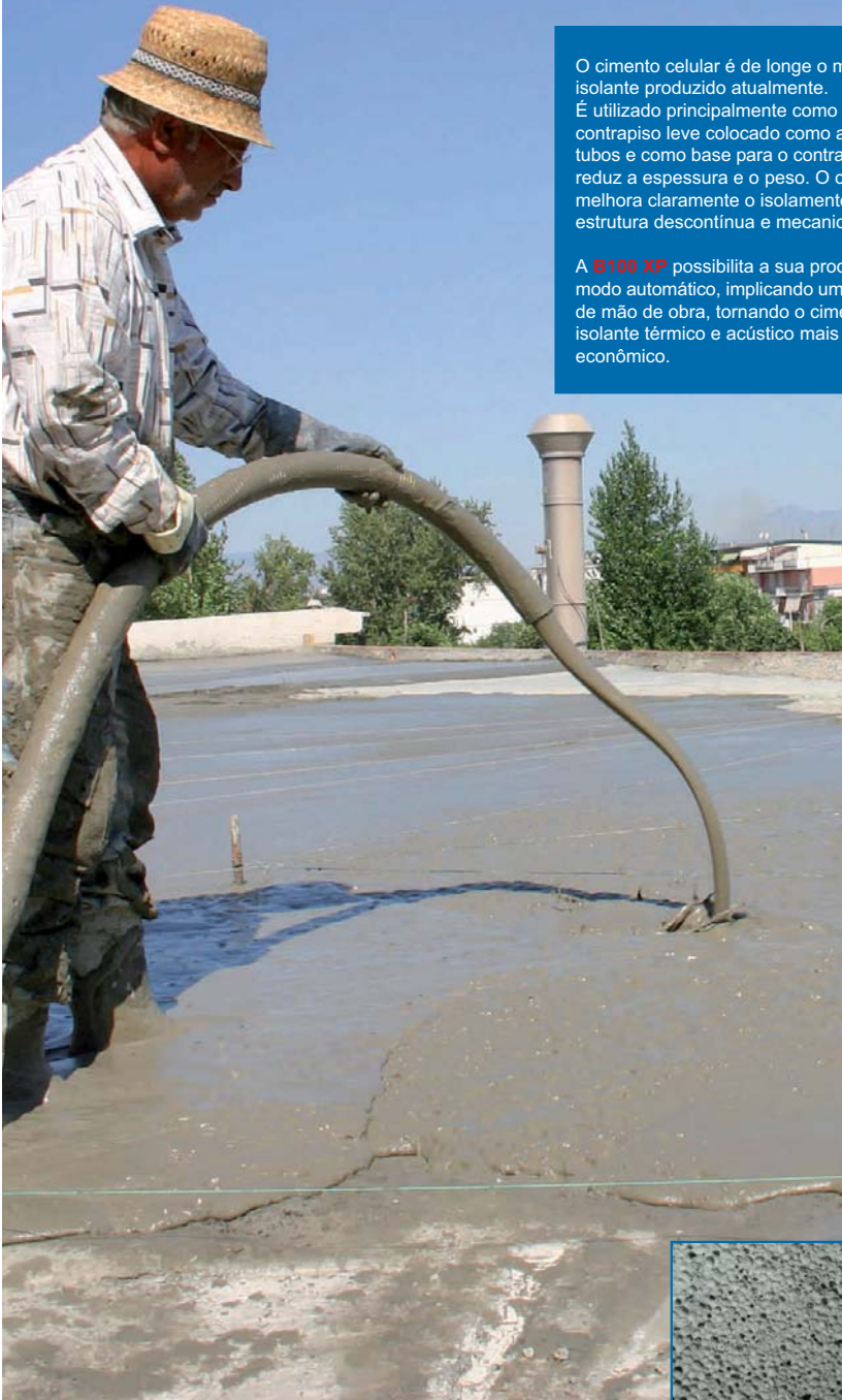
Bombeamento de cimento celular Curtume Russo – Nápoles