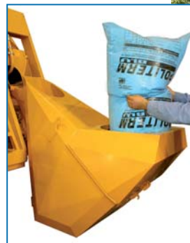
Carga de poliestireno expandido em pérolas aditivadas