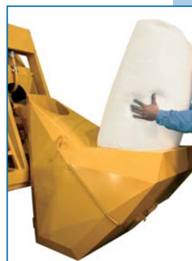
Carga de poliestireno expandido em pérolas

A betoneira é dotada de uma caçamba de carga com balança digital e pá de raspagem para uma mais precisa dosagem do material e de um rápido carregamento.