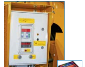
cartão de memória integrado