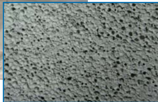
estrutura do cimento celular

O cimento celular é de longe o mais econômico material isolante produzido atualmente. É utilizado principalmente como contrapiso isolante e contrapiso leve colocado como alisamento a nível de tubos e como base para o contrapiso tradicional, do qual reduz a espessura e o peso. O cimento celular também melhora claramente o isolamento acústico devido à sua estrutura descontínua e mecanicamente fraca.