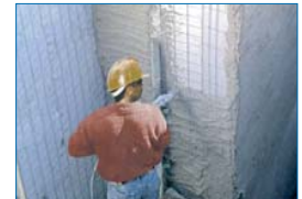
Projeção de reboco sobre painéis de poliestireno com rede metálica