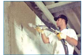
Projeção de reboco