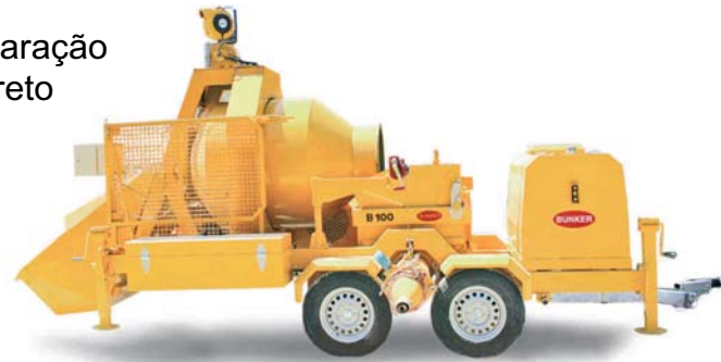
B100xp equipada com duplo eixo Alko com freio de inércia

Unidade móvel para preparação e bombeamento de concreto