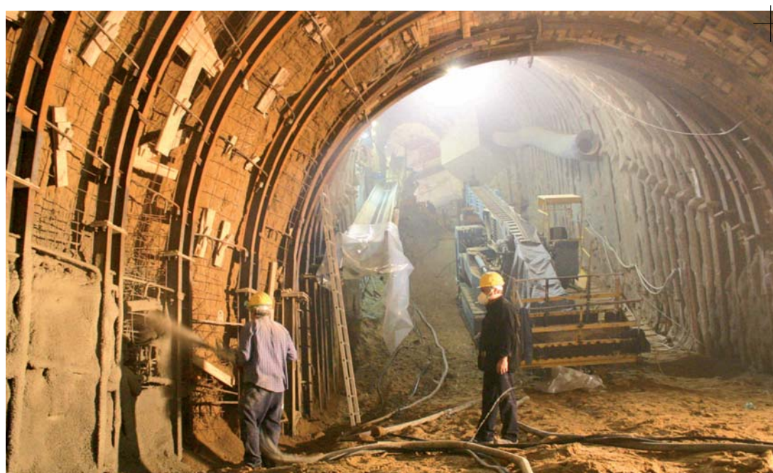
Concreto projetado em túneis Obras do metrô de Nápoles

A B100 XP possibilita a sua produção e instalação em modo automático, implicando uma pequena necessidade de mão de obra, tornando o cimento celular o material isolante térmico e acústico mais prático, eficaz e econômico.